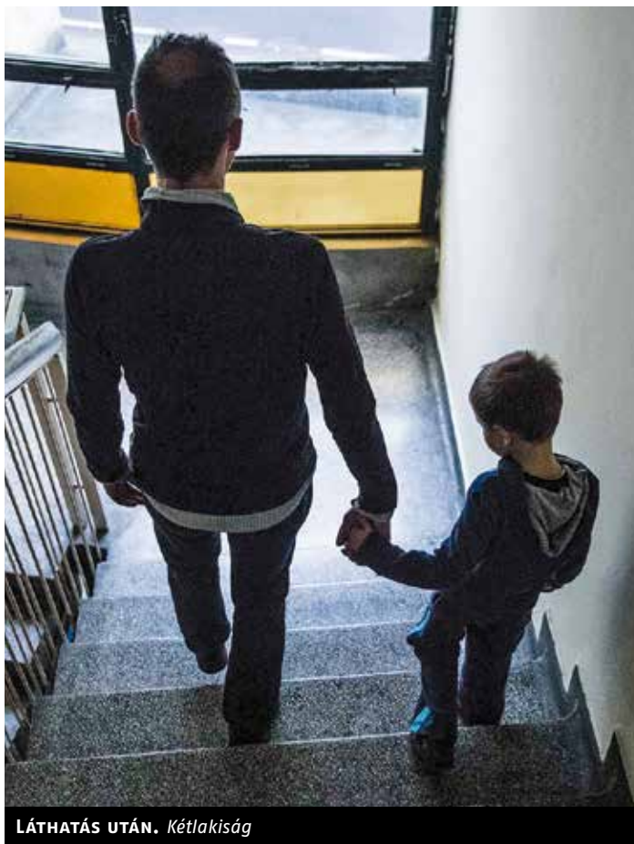
LÁTHATÁS UTÁN. Kétlakóság

Hasonlóan abszurd élethelyzetbe évente több ezer szülő, jellemzően férfi