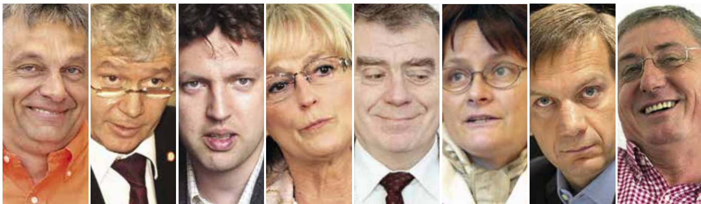
SEMÉLYISÉGI JOGI VITÁKBA KEVEREDETT KÖZSZEREPLŐK. Megvágott Ptk.