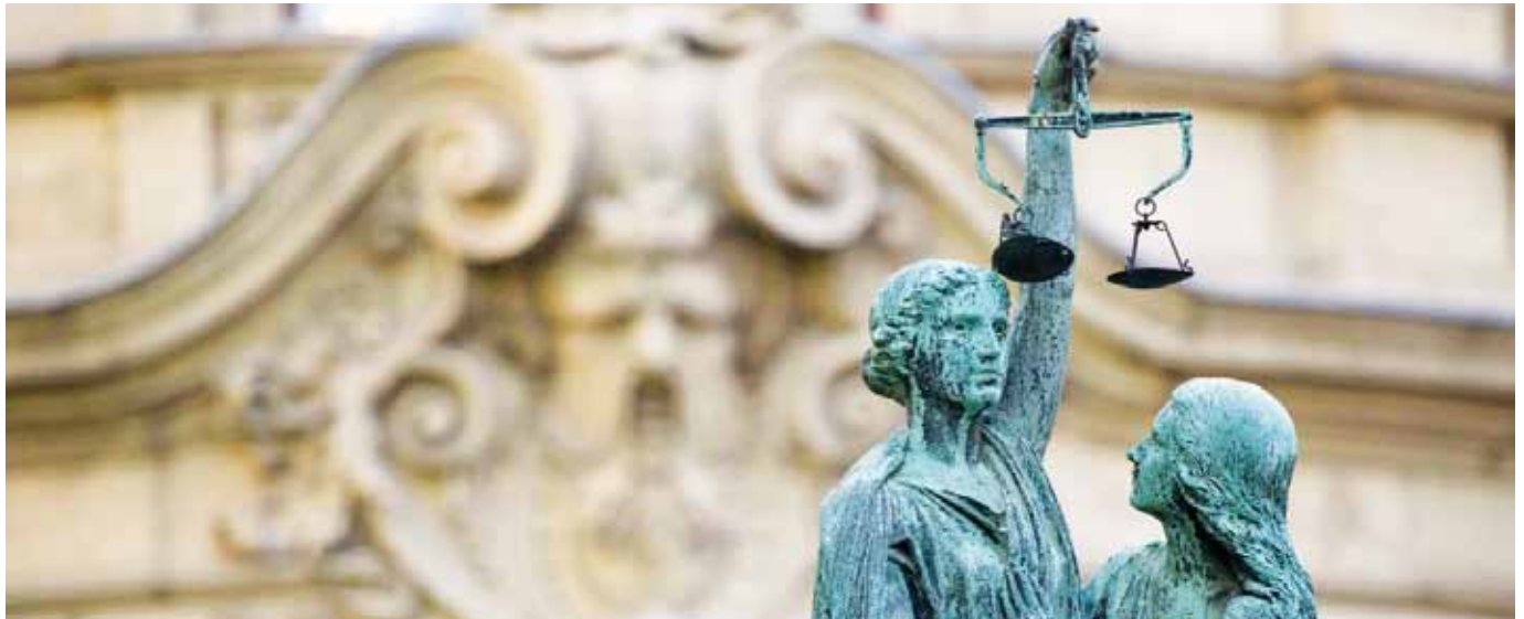
JUSTITIA-SZOBOR. Mérlegelni kellett

M ÉRETEIBEN ÉS AMBÍCIÓIT TEKINTVE is hatásos alkotás az Országgyűlés által éles kanyarokat sem nélkülöző, majdhogynem tizenöt évnyi előkészítő munka eredményeként elfogadott új polgári törvénykönyv. Nyolc könyvben közel 1600 paragrafus a tulajdon, a szerződés és az öröklés klasszikus témái mellett – Magyarországon első ízben – egy fedél alatt szabályozza a 251 paragrafust felölelő családi jogot, valamint a gazdasági társaságok jogát a maga masszív, majdnem 300 szakaszával.