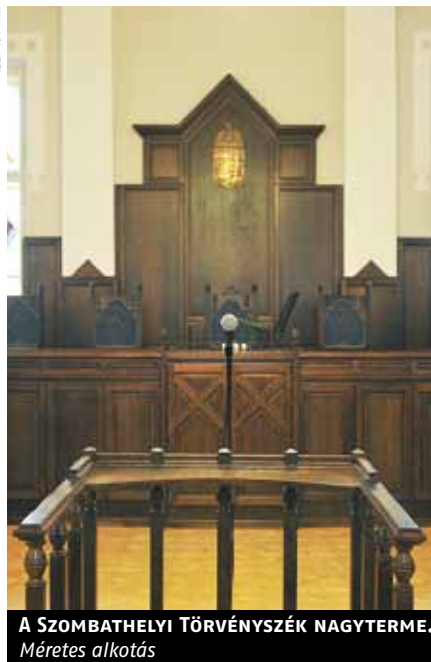
A SZOMBATHELYI TÖRVÉNYSZÉK NAGYTERME. Méretes alkotás

a jövőben válik valósággá, a lényeg, hogy legyen az adós személyéhez köthető nyilvántartása. A megoldás egyszerű – ahol működik, ott rendkívül olcsó – elektronikus nyilvántartási rendszerre épül. Ennek azonban még az alapkövét sem látjuk Magyarországon. Tudható, hogy a bankok igen nehezen, nyögvenyelősen fogadták el ezt a rendet, amely sok tekintetben változtat az eddigi „diktálás” gyakorlatukon. A közjegyzők sem tapsoltak, és még az is lehet, hogy az ügyvédek is a bonyolultabb hitelbiztosítéki hókuszpókuszban érdekeltek. Pedig ha van új, ígéretes és okos dolog ebben a kódexben, amely mind az üzleti élet, mind a fogyasztók érdekeit szolgálja, akkor a hitelbiztosítéki jog ilyen.