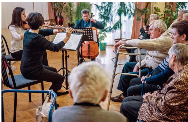
Koncert egy öregotthonban. Roszszul hangzó érvék

Jobban hangzana a baloldali érvelés, ha a Medgyessy–Gyurcsány–Bajnai-kormányok idején kevesebb lett volna a teher a munkajövedelmeken, és lényegesen nagyobb lett volna az öreggondozás vagy akár a gyermekvállalás támogatása. Valójában a rendszerelváltás előtt is, után is elsősorban családi ügy az idős felmenők ellátása. Ez ősi parancs, így a szülőtartás inkább morális, nem pedig jogi kérdés, ami paragrafusügy benne, az viszont nem nagy újdonság.